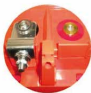
M8 Innengewinde Top Terminal